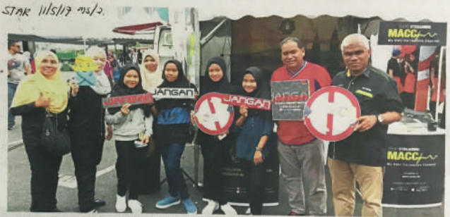
Don't give bribes: Visitors to the MACC booth showing their support for the anti-corruption campaign during a carnival at the National Stadium in Bukit Jalil, Kuala Lumpur.