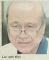
Lee Lam Thye

Nab Pengerusi Kanan Yayasan Pencegahan Jenayah Malaysia (MCPF), Tan Sri Lee Lam Thye, berkata pertambahan kes dadah menyebabkan mahkamah mengalami kesukaran menyelesaikan kes