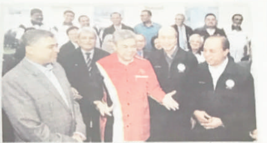
AHMAD Zahid bersama Ketua Polis Negara merangkap Timbalan Pengerusi MCPF, Tan Sri Khalid Abu Bakar (kiri), semalam

"Penubuhan mahkamah berkenaan akan membolehkan mahkamah biasa memberi tumpuan kepada percabaran kes utama lain kerana ia dapat mengatasi masalah dari aspek kesediaan kepada semua," katanya.