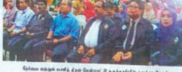
செலாங் பிரதேச ஆக்டிவ் பொதுத்தர்ப்பு தாய் தாய் சர்ச்சைகளால் நாட்டின் ஒருமைய்பாடு சீர்குலைகிறது.

இனதுவேச சர்ச்சைகளால் நாட்டின் ஒருமைய்பாடு சீர்குலைகிறது. இனதுவேச சர்ச்சைகளால் நாட்டின் ஒருமைய்பாடு சீர்குலைகிறது. இனதுவேச சர்ச்சைகளால் நாட்டின் ஒருமைய்பாடு சீர்குலைகிறது.