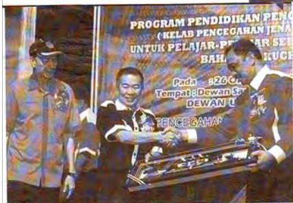
Noroden menerima cenderahati selepas merasmikan Program Pendidikan Pencegahan Jenayah Malaysia, di Petra Jaya.