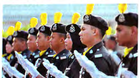
ANGGOTA perbarisan kawalan kehormat pada Sambutan Hari Polis ke-207 turut berdo'a untuk pemungutan dan kew pesawat MH370 di pekarangan Ibu Pejabat Polis Kontinjen Polis (IPK) Kedah

TAN SRI LEE LAM THYE ialah Naib Pengerusi Yayasan Pencegahan Jenayah Malaysia (MCPF)